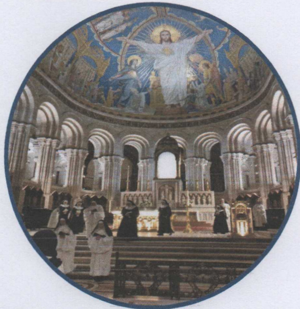
Nuestras Madres en la Basílica en Montmartre.