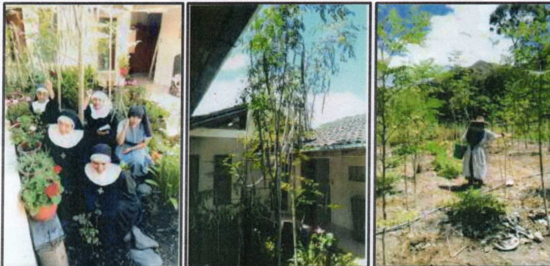
Estrago en nuestra Finca cuando creció el Río y se llevó una parte de tierra.